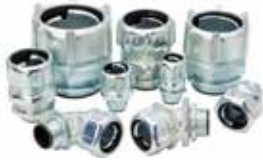
Série 5300-HT Liquidtight haute température