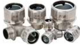
Série 5300SST6HT haute température