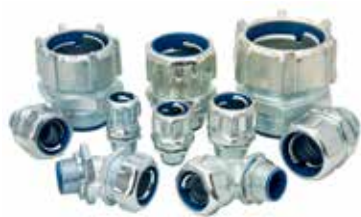
Raccord LT acier