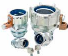
Raccord de mise à la terre LT acier