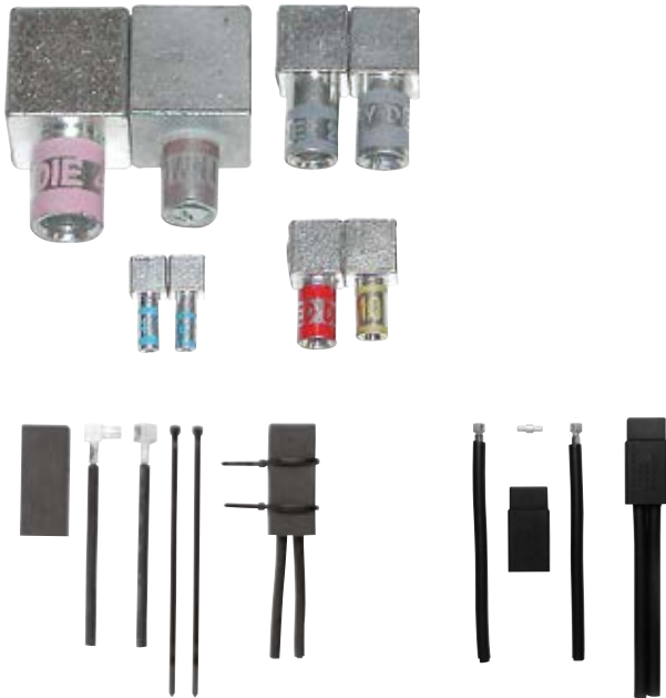
Modèle 600 V