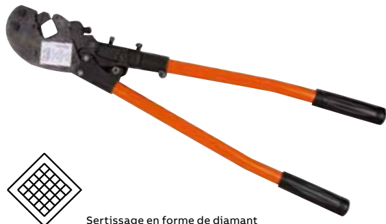
Sertissage en forme de diamant