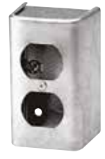
1199 (Pour réceptacle double)