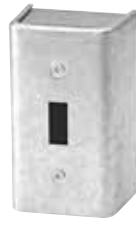
1151 (Pour interrupteur)