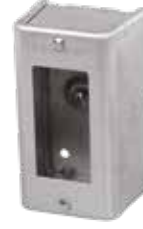
1198 (Pour Decora ou DDFT)